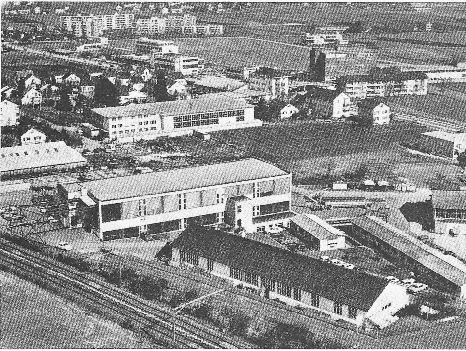
«Misshandelte Landschaft, bauverschmutzte, verluterte Umwelt» (aus einer Bauordnung: Neu- und Umbauten sowie Aussenrenovationen jeder Art sind im ganzen und in ihren einzelnen Teilen so zu gestalten, dass eine befriedigende Gesamtwirkung gewährleistet ist...) Dietlikon ZH (Bild 40)

Nur schon als Konzentrat der Hässlichkeit, der Unmenschlichkeit heutigen Bauens wäre Kellers Buch wertvoll. Doch es ist mehr: Denn wir sind in vielen Fällen gar nicht mehr fähig, das Ausmass der Zerstörung zu sehen, weil der Mensch nicht nur seine Umwelt prägt, sondern selbst von dieser Umwelt geprägt wird, ist seine Immunität gegenüber einer hässlichen, einer krankmachenden Umwelt im höchsten Masse gefährlich.