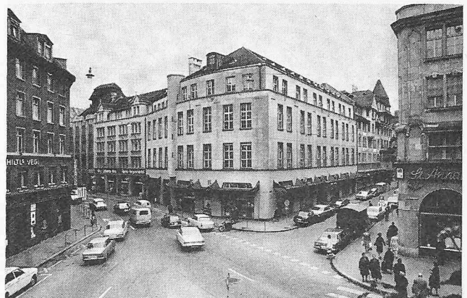
Bild 1. Telefonzentrale Füssli, die «City-Centrale» von Zürich (1925)

Zentrale zu installieren. Im Juni 1971 wurden sodann die Abonnenten von Füssli 1 mit der Kennziffer 23 an die Zentrale Aussersihl und im November 1971 diejenigen von Füssli 2 mit der Kennziffer 25 an die Zentrale Enge angeschlossen. Der Umschaltvorgang erforderte jeweils umfangreiche und komplizierte Vorbereitungs- und Ausführungsarbeiten im Kabelnetz und in den Zentralen. Nach dem