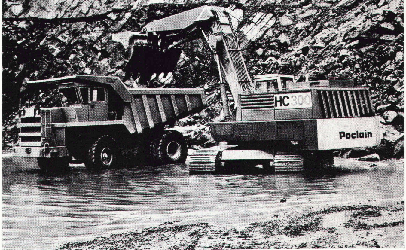
POCLAIN Hydrobagger Mod. HC 300 und WABCO Muldenkipper «Haulpak» mit 35 t Nutzlast

POCLAIN baut 18 verschiedene Hydrobagger, darunter vier ausgesprochene Hochleistungs-Raupenbagger für die wirtschaftliche Bewältigung grosser Bauvolumen.