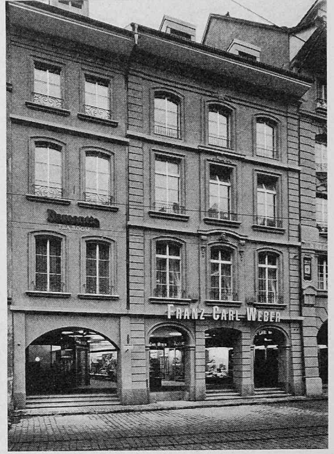
Bild 9. Marktgasse 52. Fassade nach der Wiederherstellung, 1960

acht- oder viereckige Treppe des frühen und mittlern 17. Jahrhunderts (Beispiele: Gerechtigkeitsgasse 33, Kramgasse 24), das längs- oder querrechteckige Treppenhaus im Hofraum, der Normaltyp des 18. Jahrhunderts (Beispiele: Kramgasse 9 und 54, Gerechtigkeitsgasse 62 und 64, Bild 6); schliesslich, als repräsentativste und seltenste Anlage, das geräumige quadratische Treppenhaus unmittelbar hinter der Hauptfront, Typus Erlacherhof und Burgerspital (privates Beispiel: Amthausgasse 5).