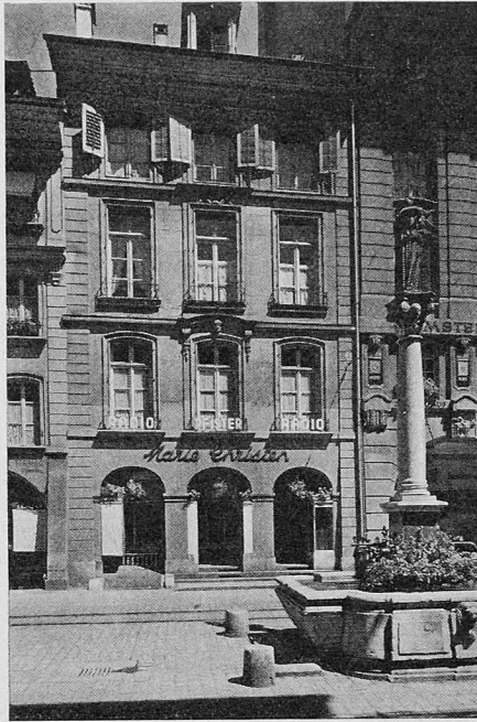
Bild 8. Marktgasse 52. Vor dem Umbau