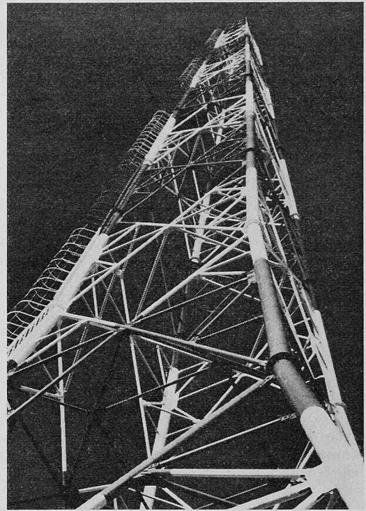
Rohrmast System Motor-Columbus in Tenerifa, Islas Canarias, Höhe 75 m

dass eine einflussreiche Gruppe nun plötzlich gezwungen wurde, auf seit Jahrzehnten auf Kosten der Allgemeinheit gemachte, überhöhte Gewinne zu verzichten.