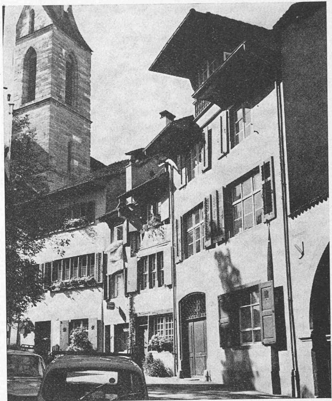
Bild 2. Klimagerechtes Bauen der «Alten»: kompakt, mit minimaler Aussenhaut und ausgewogenem Verhältnis von Loch und Wand