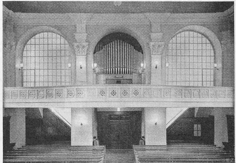
Ansicht gegen die Empore vor der Restauration (vgl. Tafel 21)

Kredit von 45 000 Fr., dem die Kirchgemeindeversammlung zustimmte. Dank privater Zuwendungen konnte auch noch ein neues Hauptportal geschaffen werden. Bildhauer Otto Münch in Zürich hat es meisterhaft verstanden, im Rundbogen die Symbole der vier Evangelisten Matthäus, Markus, Lukas und Johannes künstlerisch darzustellen. Die Kirche wurde am 30. Oktober 1949 der Gemeinde wieder übergeben.