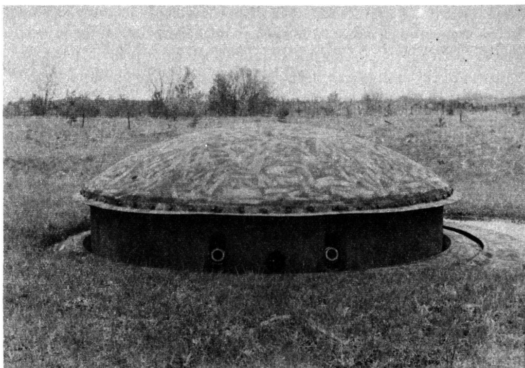
Fig. 3: Tourelle de 75 à 2 tubes, modèle 33. Portée max. 11 800 m. 24 coups/minute. La tourelle est ici en position de tir. Eclipsée, elle offre une excellente protection à ses tubes. Le mot d'ordre de l'artillerie de forteresse française semble être: «Aucune volée extérieure! Toutes les armes sous protection blindées!» Si l'on songe que la fortification Maginot est née des enseignements tirés de la Bataille de Verdun et de son déluge de feu, on comprend mieux cette conception de protection quasi absolue!

Mon bloc de 13,5 cm de l'ouvrage d'Anzeling (à 9 blocs, dont 4 d'artillerie), aile droite du front des gros ouvrages de la trouée de la Moselle, et sensiblement au centre de l'ensemble allant jusqu'au Rhin, comprenait trois pièces: deux jumelées sous tourelle, la troisième armant une casemate située 15 mètres plus bas, dans le même bloc de béton. Sans jamais voir l'objectif, je me conduisais comme un commandant de batterie, responsable de ses tirs de bout en bout, après avoir été relié, sur ordre du commandant d'artillerie de l'ouvrage, à l'un des quatre observatoires cuirassés latéraux qui avait signalé l'objectif.