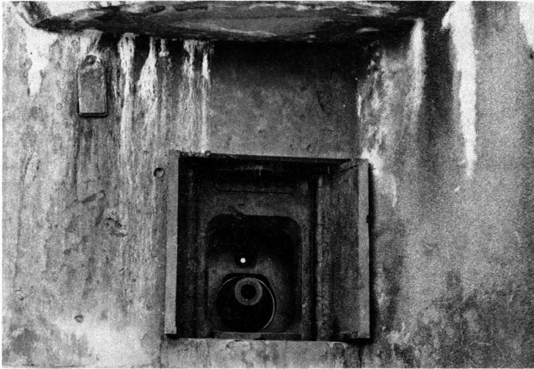
Fig. 2: Embrasure du 75, modèle 32 de casemate. Au-dessus du tube, la lunette de visée pour le tir direct antichars. A gauche, petite embrasure pour le FM de défense du fossé.