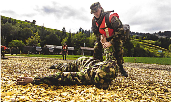
Ci-dessus et ci-dessous: la cp car 14/1 à l'instruction axée sur l'engagement (IAE), respectivement tir et techniques d'arrestation et d'immobilisation.