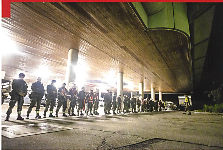
Arlesheim, poste central du Cgfr: relève d'une section de la cp car 14/1 (équipe «jour tard» par équipe «nuit»).