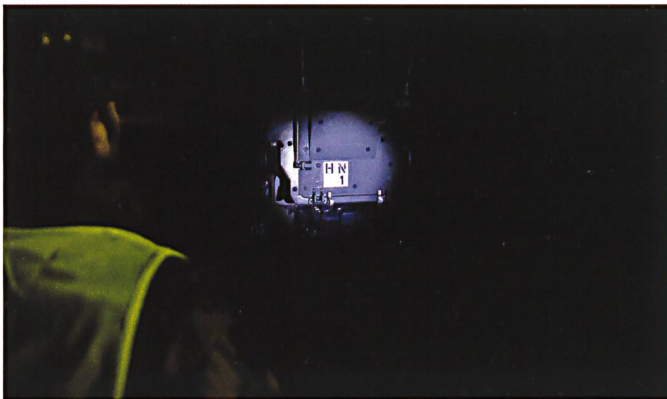
Ci-dessus : Un poste d'observation de la cp car 14/1, utilisant un GMTF et ses moyens d'observation nocturne, à l'engagement dans son secteur Nord.