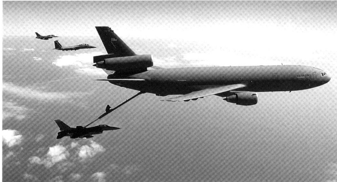
Le KC-10 Extender est un appareil plus récent, plus lourd, mais également plus coûteux que le KC-135.

des investissements ne peuvent, à terme, qu'entraîner une hausse du prix unitaire de l'appareil au-delà de la barre des 130 millions de dollars, bien au-delà des 30 millions prévus pour un appareil « abordable »... 7