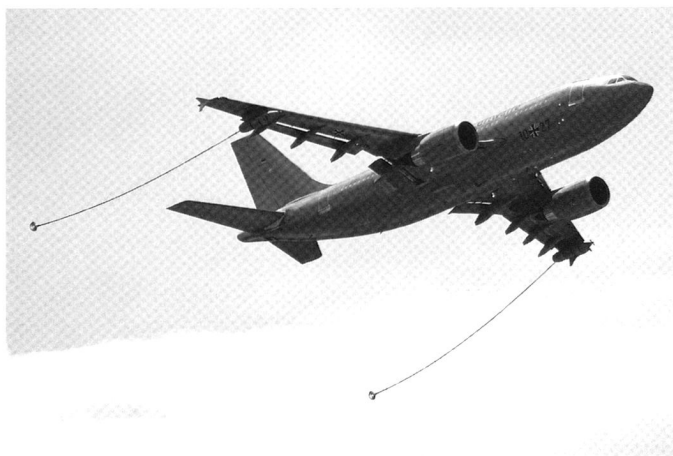
L'A310 MRTT, équipé de deux perches de ravitaillement en bouts d'ailes.

Après une hésitation entre 4 et 5 appareils, l'Australie a commandé et recevra ses deux premiers A330 MRTT (KC-30A) à la mi-2010, avec 12-15 mois de délai. Le troisième sera livré à la fin de l'année, et les deux derniers en 2011 et en 2012 respectivement. 29