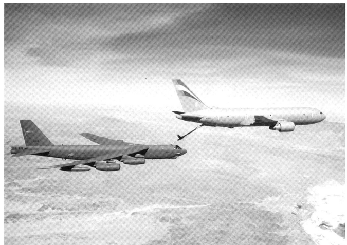
Boeing KC-767 italien, ravitaillant un B-52H Stratofortress en 2007.

En 2001, les Forces de défense aériennes japonaises (JASDF) ont sélectionné le KC-767 devant une version de l'Airbus 310, et signé l'achat de 4 appareils en 2003. Ceux-