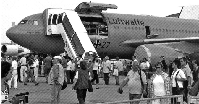
L'Airbus A310 MRT de la Luftwaffe allemande, en configuration d'évacuation médicale (MEDEVAC).