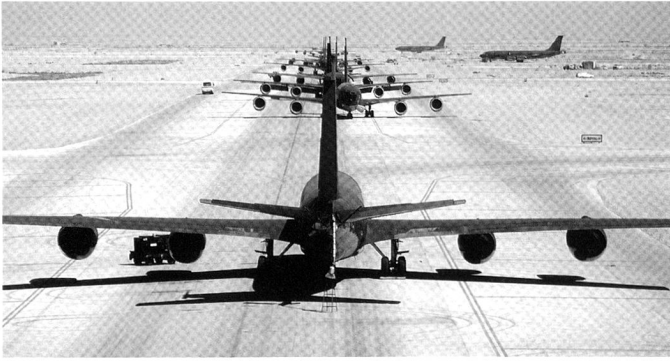
L'US Air Force conserve une flotte importante de KC-135 Stratotanker , un appareil techniquement dépassé, mais loin d'être obsolète.