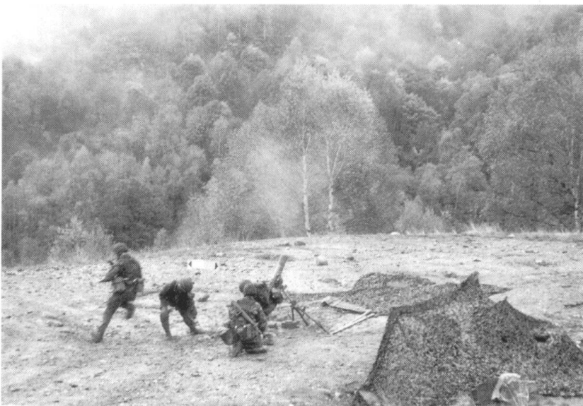
«Coup parti». L'école de recrues d'Isonne a présenté grenadiers et canonniers de façon très dynamique.