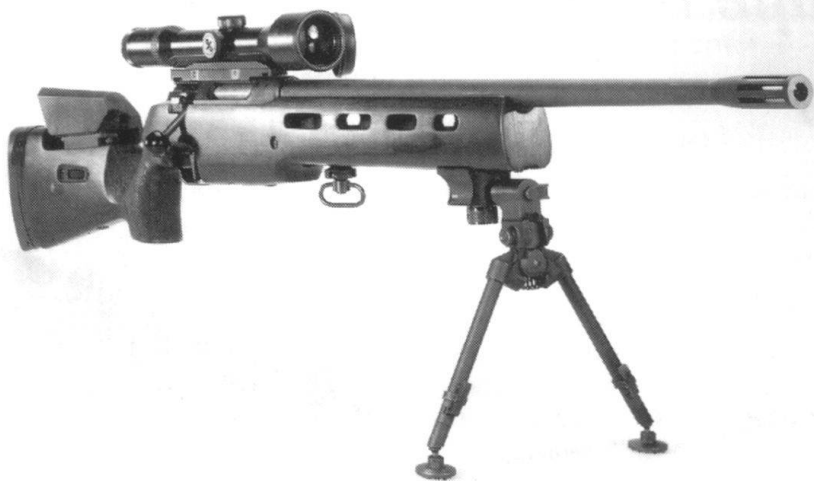
Parmi les entreprises présentées aux congressistes, SIG et sa carabine de tireur d'élite modèle SSG 3000.