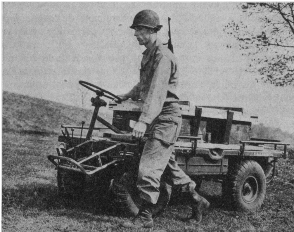
FIG. 4. — La « mule mécanique ».

la première ligne du champ de bataille, et qu'elle se camouflera facilement. Elle pèse 300 kg., soit 50 de moins que la Vespa 2CV. dont on annonce la sortie d'usine, et peut se charger à 450 kg. Ses quatre roues étant directrices, elle peut tourner dans un cercle de 5 m. 4. Comme le montre la figure 4,