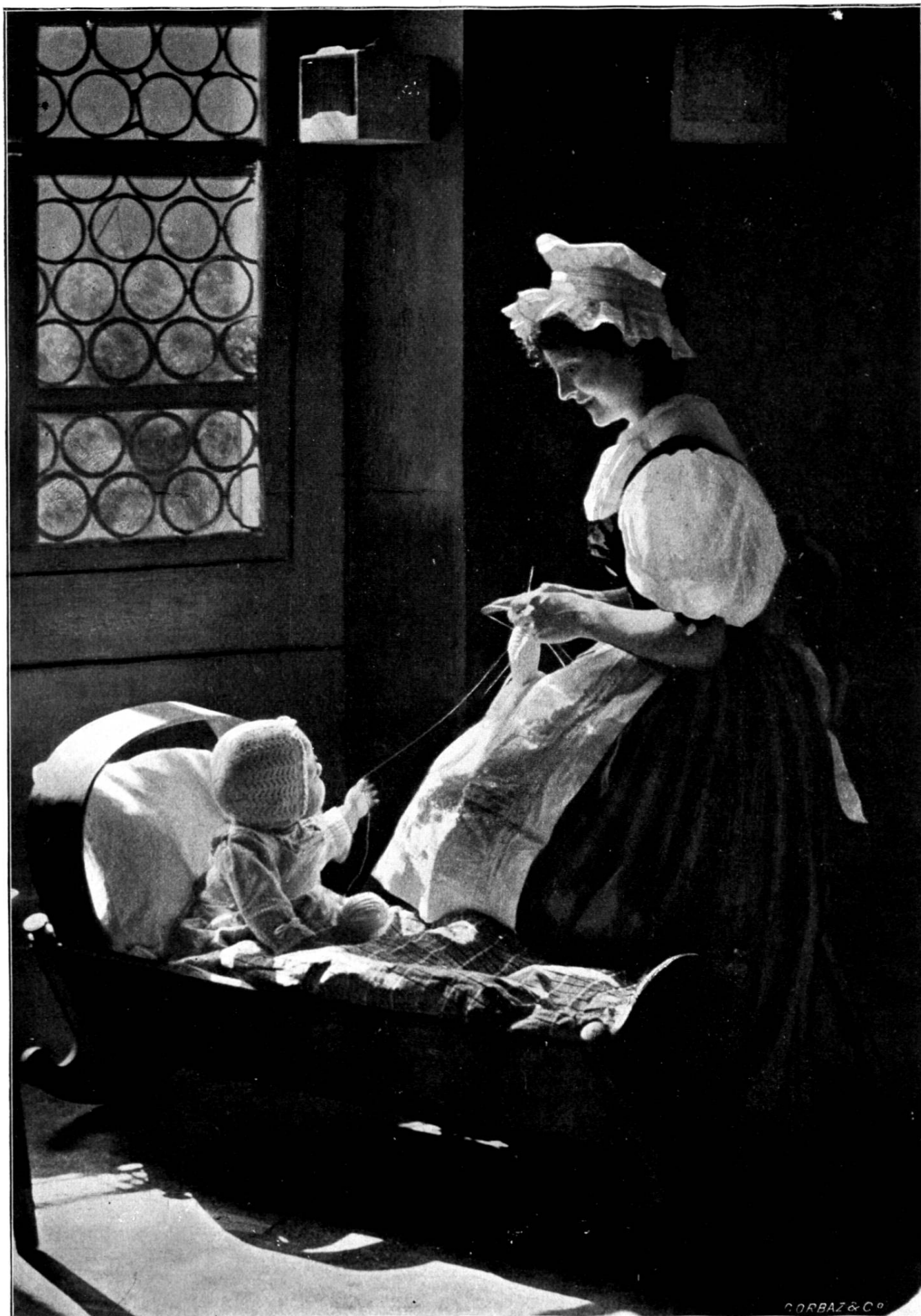
Premier prix du III e concours du „Journal Suisse des Photographes.“