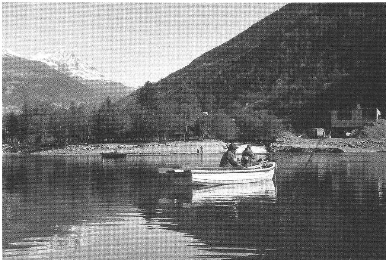
Pescatori al lago di Le Prese, alla foce del Poschiavino, inizio maggio 2003

mente durante il periodo d'attesa, antecedente l'apertura della pesca, il richiamo è particolarmente intenso. È quella passione che ti fa mettere per esempio la sveglia nelle ore piccine della notte, onde poter essere in tempo sul posto buono, dove presumi sia efficace per le catture.