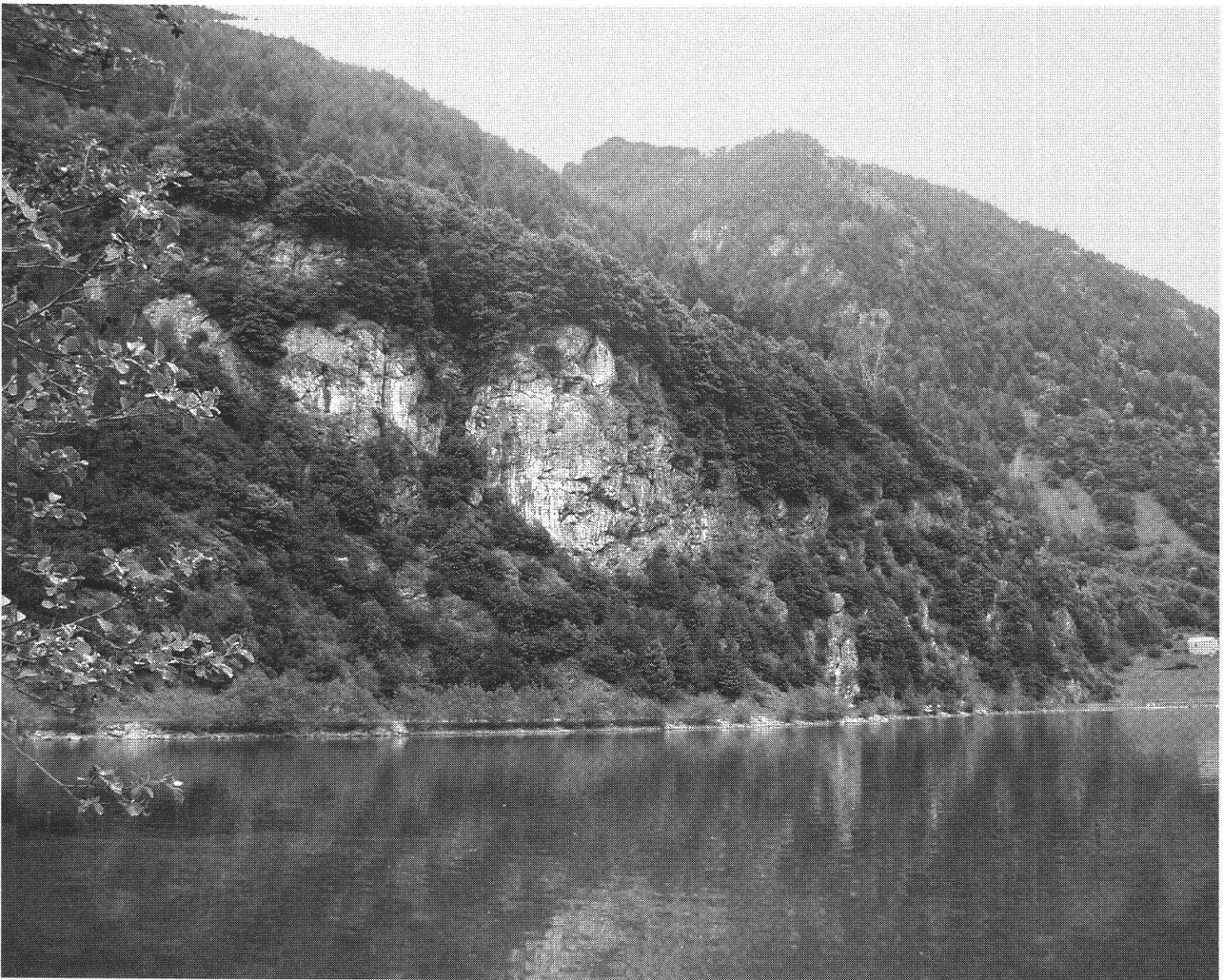
Il Bottolo con il Sass, foto di fine maggio 2003. Ai tempi in cui Achille Bassi ha composto la sua poesia, Serata di pesca al Bottolo (1953), probabilmente la vegetazione aveva un'altra configurazione. Sopra il Sass infatti c'erano campi e prati, oggi imboschiti