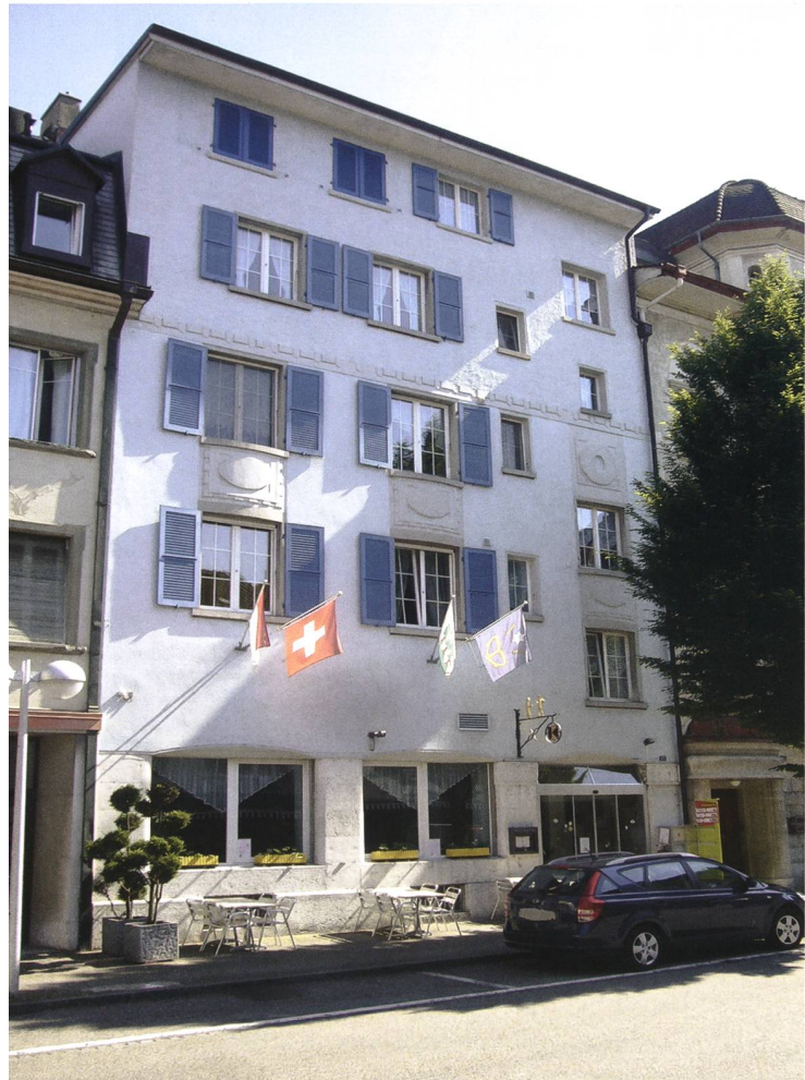
Das heutige Restaurant Kolping, bis 1985 Gesellenhaus Olten