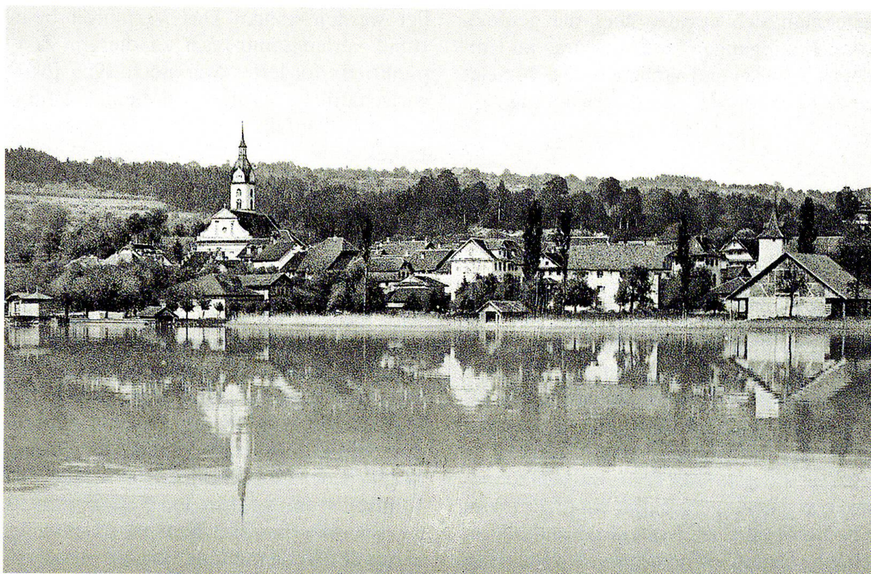
Abb. 7: In Sempach formierte sich die Opposition: Ein Aktionskomitee wehrte sich gegen die Stauseeprojekte (Postkarte von Sempach um 1908).

Sempach an der Sitzung vom 16. September 1921 in Aussicht, eine Protestversammlung einzuberufen. Die grosse Versammlung vom 2. Oktober entthob ihn dann dieser Entscheidung.