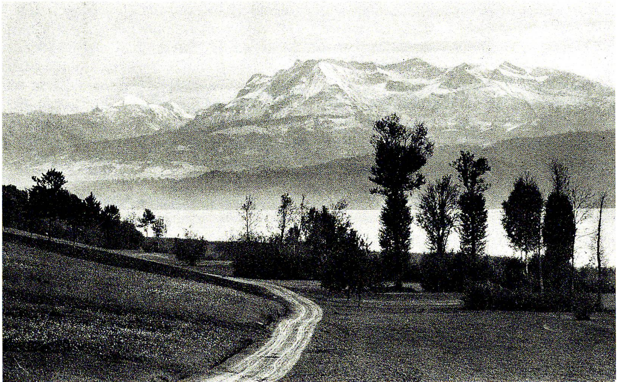
Abb. 1: Am Sempachersee wurde von den Projektverfassern wenig Opposition gegen die Stausee-projekte erwartet (Postkarte um 1911).

Seespiegels vorhanden sind» (Konzessions-gesuch).