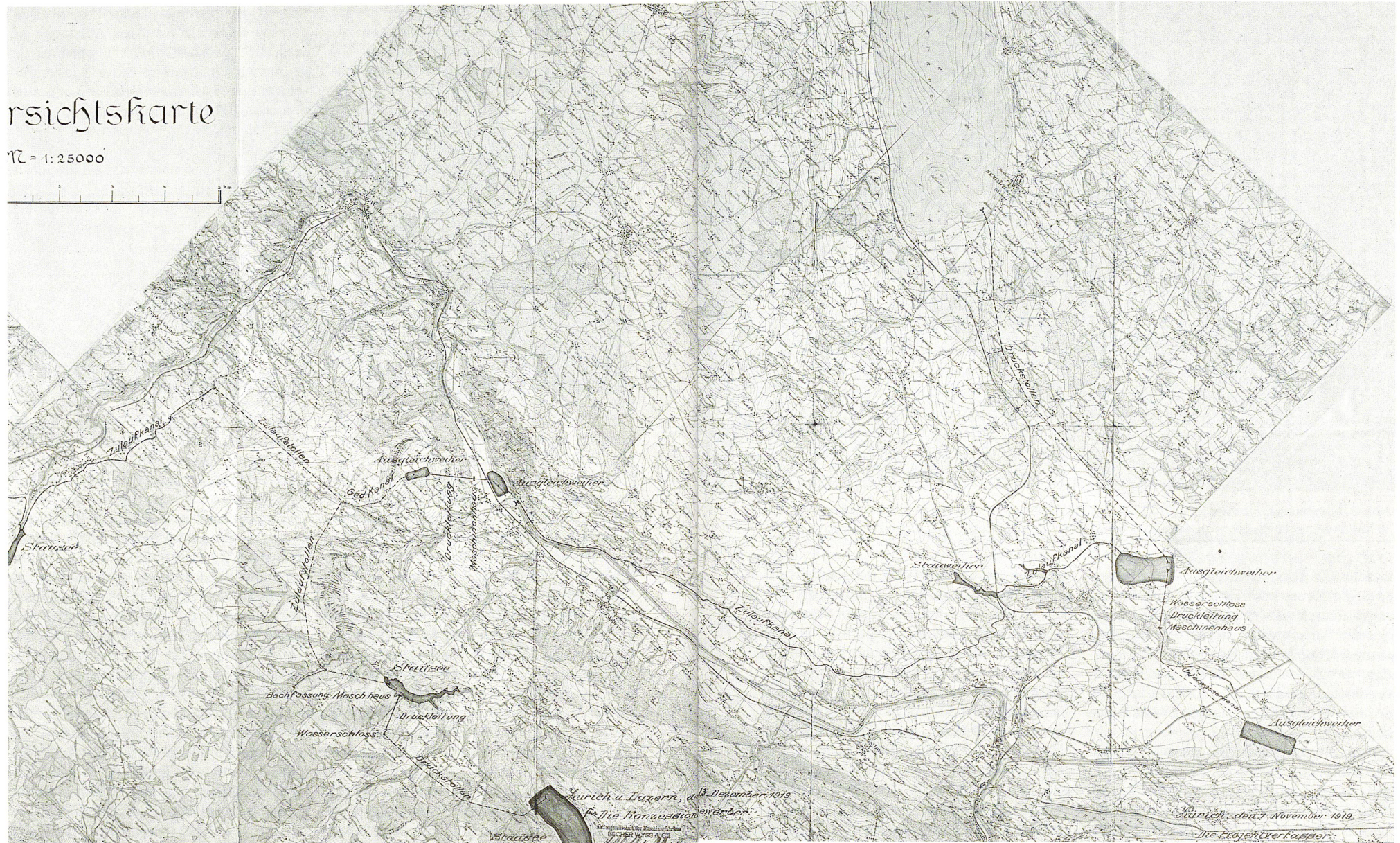
Abb. 2: Ausschnitt aus der Übersichtskarte zum Projekt «Waldemme – Sempachersee»: In Stollen sollte das Wasser von den Staustufen an der rechten Talflanke des Entleuchs zum Stausee bei

Rothenburg und in den Sempachersee als Hauptspeicherbecken fließen (Escher-Wyss & Cie 1919; Staatsarchiv Luzern).