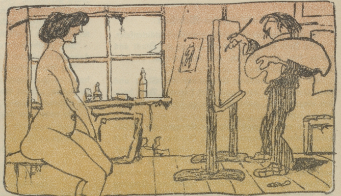
Die Mutter sitzt im Stiller.