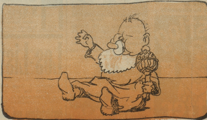
Der Kleinste geht, sobald er kann.