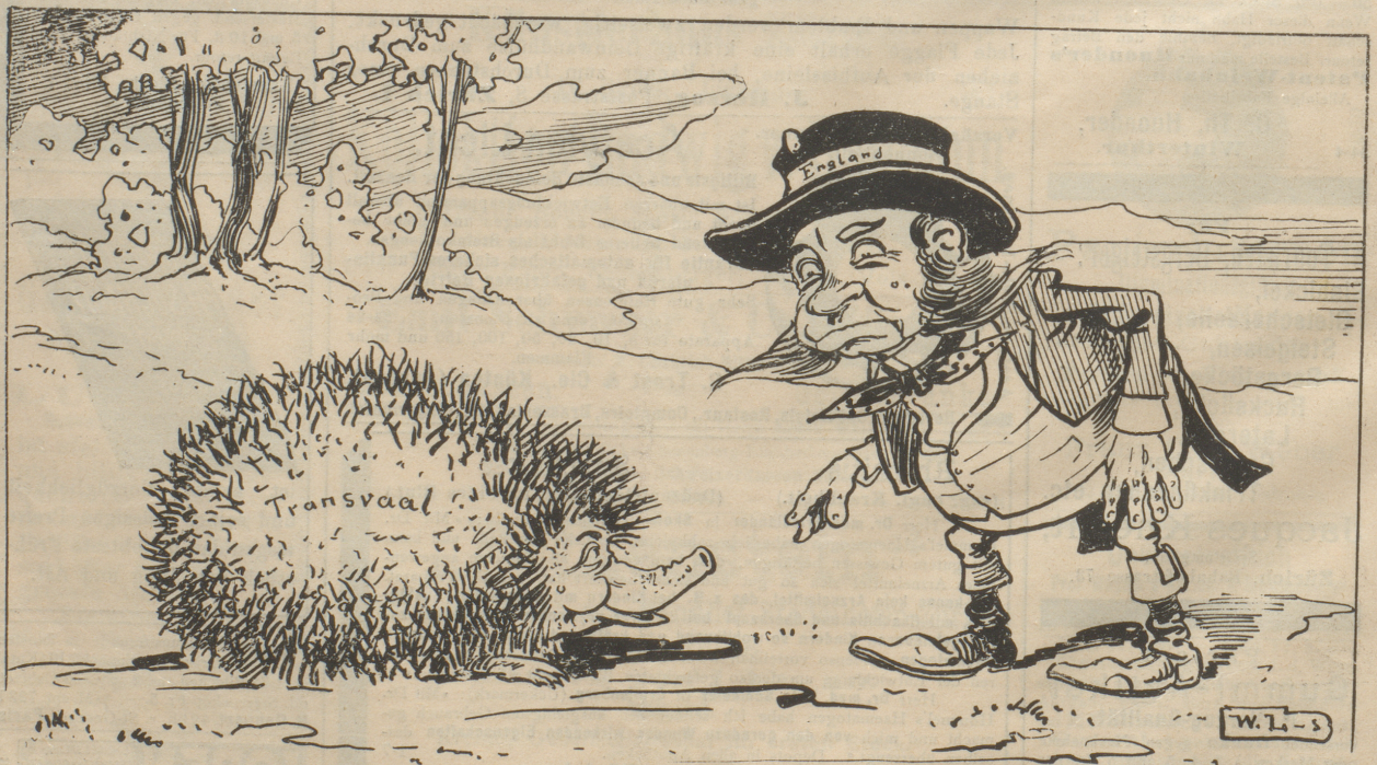
John Bull: „Ja, wenn ich nur diesem verfluchten Vieh beikommen könnte.“