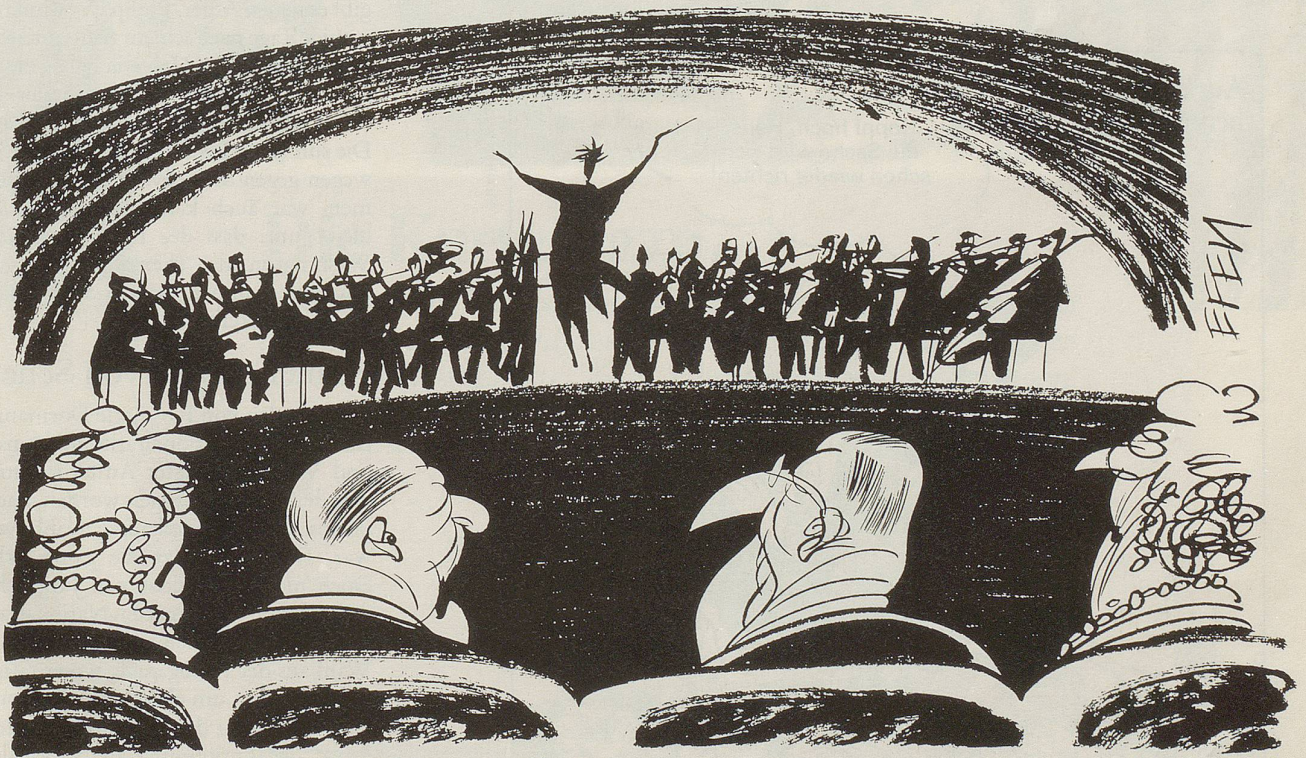
Musikfestwochen in Luzern: Wo sich Kunst- und Geschäftsleben finden ...

« WIR HABEN UNSEREN UMSATZ presto tempo VERBESSERT UND SUCHEN NUN pianissimo NEUE ANLAGEMÖGLICHKEITEN »