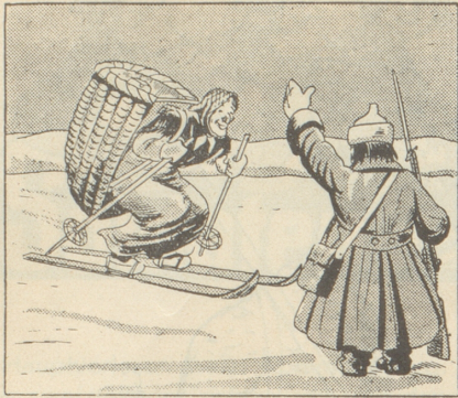
Hast Du da ein Geschenk für mich!»