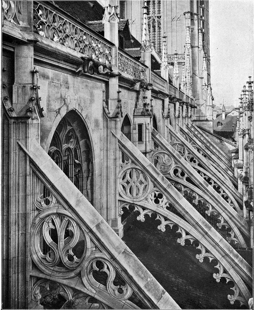
Strebebogen an der Nordseite des Münsters