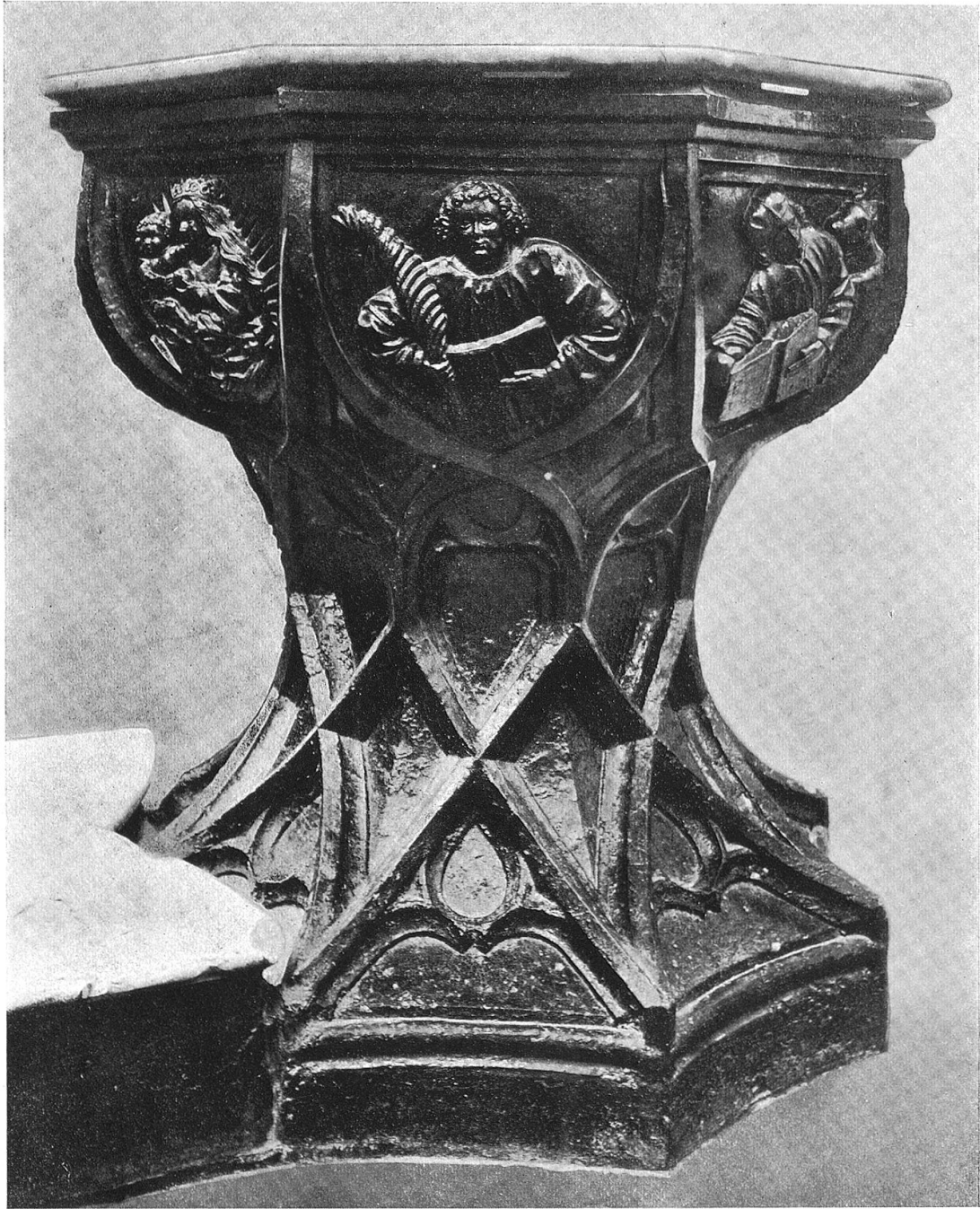
Taufstein im Berner Münster