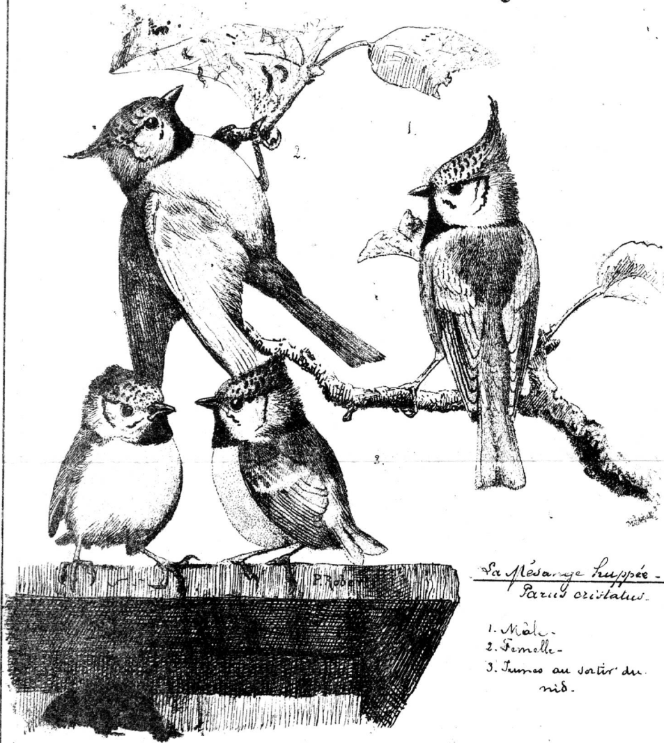
La Mésange huppée - Parus cristatus.