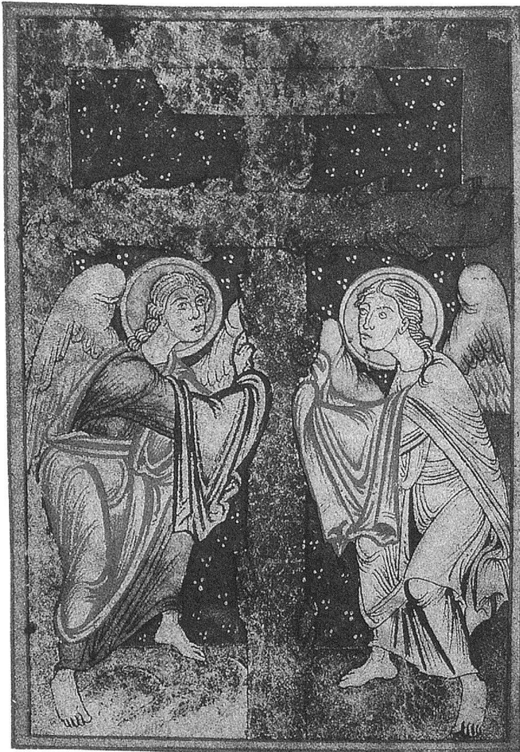
Seite 145: «Sehnsucht nach dem Herrn». Die großartige Darstellung mit den beiden Engeln unter dem Kreuz als Abschluß des ganzen Gebet-Bild-Zyklus.