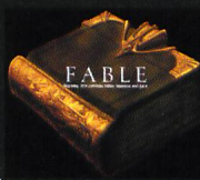
Fable Hersteller: Microsoft - Xbox Erscheinungsdatum : 23. 11. 04 Genre: Action-Adventure