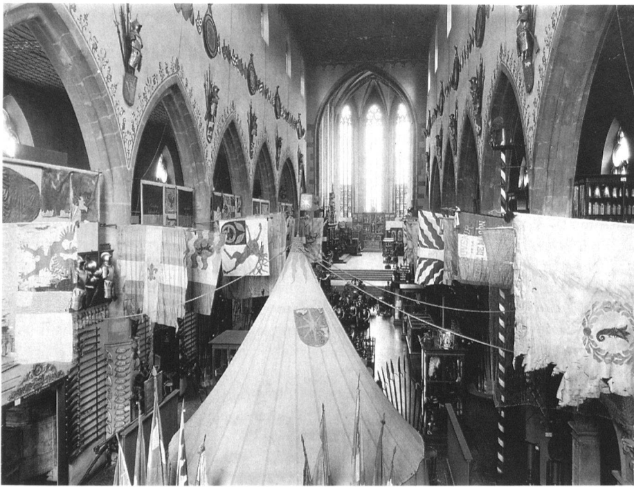
Historisches Museum Basel in der ehemaligen Barfüsserkirche, Zustand nach der Eröffnung 1894.