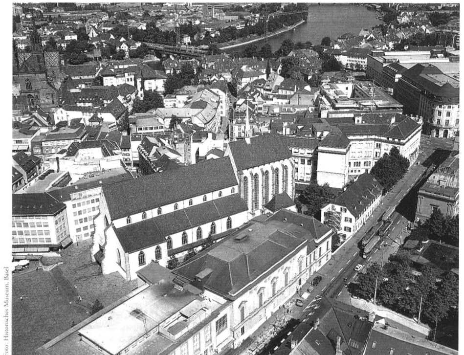
Basel, Barfüsserkirche, die seit 100 Jahren das Historische Museum beherbergt. Luftaufnahme 1993.