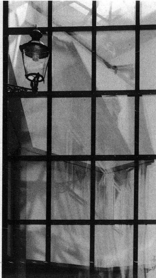
Esther Baur Sarasin St. Alban-Tal in Basel