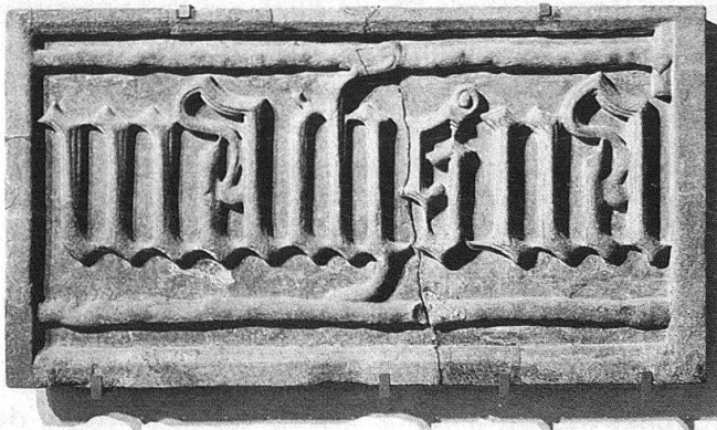
Bern, Münster, «machs na», Inschrift an der Pfeilerbrüstung östlich der Schultheissenpforte, um 1500. Original im Bernischen Historischen Museum.