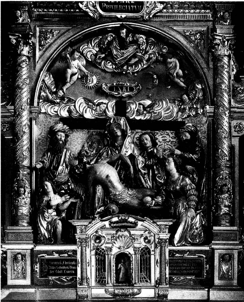
4 Luzern, Seelaltar in der Hofkirche. – Die theatrale Beweinungsgruppe mit wiederverwendem spätgotischem Vesperbild und um 1640 beifügten Assistenzfiguren von Bildhauer Niklaus Geisler. Typisch luzernische Schnitzkunst des volkstümlichen Frühbarocks.

stand war keineswegs Verbohrtheit oder gar halsstarreriger Trotz, sondern entsprang einem ursprünglichen Verlangen nach ornamentaler und bildhafter Durchformung, was dann auch tatsächlich mit übersprudelnder Phantasie geschah, sind doch an den zehn Seitenaltären ausser den vierzehn Bildern sage und schreibe 194 Statuen, Figürchen und Engelsköpfe gezählt worden. Herzhafte schnitzerische Bildkraft triumphierte hier über nüchtern-fremde Marmorkunst, die sich lediglich in dem von Rom gestifteten Hochaltar zu behaupten vermochte. Besonders auffallend an diesem ungestümen Gestaltungsdrang ist jene Leidenschaft zu veranschaulichen und in thematischen Zusammenhängen bilderreich zu visualisieren, was damals eine wesentliche Leitform im Schaffen der Maler und Bildhauer war. Offenbar handelt es sich hier um eine besondere Eigenheit unserer Kunstlandschaft, der wir schon verschiedentlich begegnet sind. Als frühes Beispiel, vielleicht gar Ausgangspunkt, nenne ich Diebold