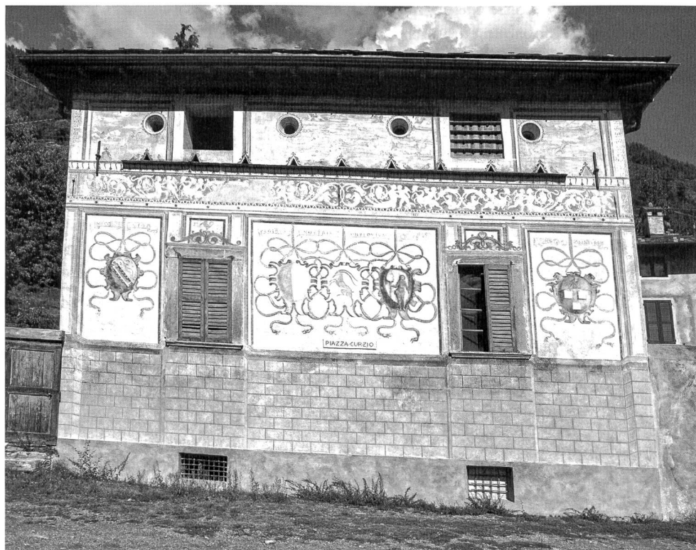
Stemme delle Tre Leghe sulla facciata della Casa Quadrio Curzio (oggi Silvestri), Ponte in Valtellina, intorno al 1550.