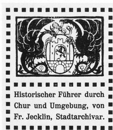
Abb. 394 Chur. Titelvignette, gezeichnet von Architekt Martin Risch 1909, in Abwandlung der Schnitzerei von 1525 über dem Rathausportal, welche das von Basiliken gehaltene Stadtwappen darstellt. Vgl. Abb. 12