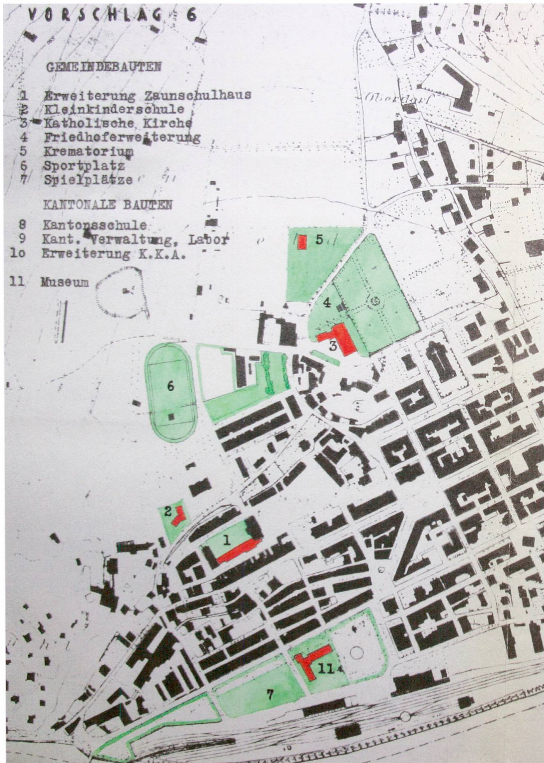
1948 war der Sportplatz noch im Gründli geplant, äusserer Zaun und Turnergut sollten für Schule und Verwaltung überbaut werden.