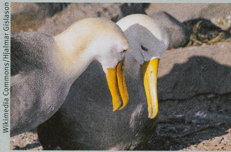
Ein Paar Galapagos-Albatrosse in trauter Zweisamkeit, die bei ihnen ein Leben lang anhält.