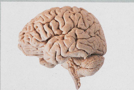
Nicht alle Hirnwindungen sind gleich, aber manche sind gleicher.

G.E. Doucet et al.: Person-Based Brain Morphometric Similarity is Heritable and Correlates With Biological Features. Cerebral Cortex (2018)