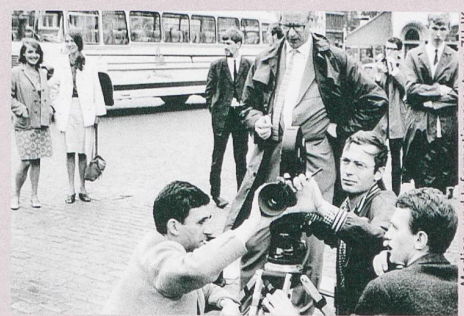
Des étudiants suisses en cinéma apprenant les ficelles du métier à la fin des années soixante.

Thomas Schärer: Zwischen Gotthelf und Godard. Erinnerter Schweizer Filmgeschichte 1958-1979 . Limmat Verlag, Zurich 2014, 701 p.