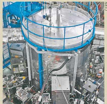
Le rôle de l'alpha-pinène a été confirmé par des expériences dans la chambre à nuage du CERN.