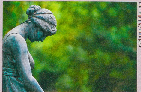
Un grand manque d'estime de soi peut rendre malheureux.

U. Orth, R.W. Robins (2013): Understanding the link between low self-esteem and depression . Current Directions in Psychological Science , 22, 455-460.