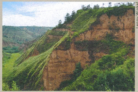
Le plateau de Loess en Chine et ses dépôts sédimentaires témoins des variations climatiques.