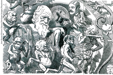
Darwin penseur controversé, ici dans une caricature de 1882.