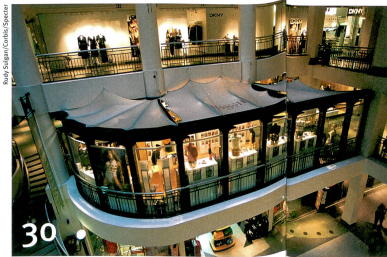
Comment mieux exploiter le sous-sol des villes, à l'exemple de Montréal.