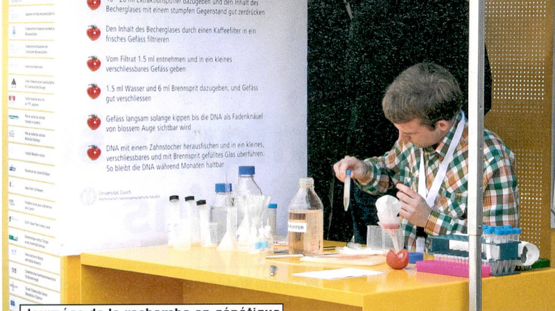
Journées de la recherche en génétique