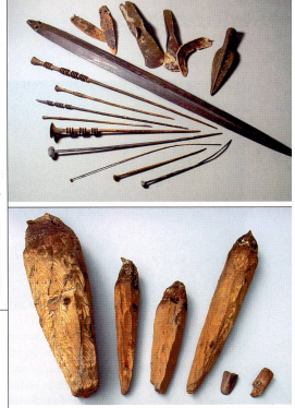
Épingles de vêtements, des lames de poignards et de haches ont en effet aussi été trouvées à cet endroit au fond du lac et seulement à cet endroit.

Selon les recherches plus récentes, la combinaison de ces différents objets montre qu'il s'agissait de vestiges de culte, en particulier quand ils gisaient dans l'eau. De tels vestiges datant de l'époque celtique ont souvent été retrouvés dans des sources, des marais, des offrandes ou sous des ponts. Les spécialistes des Celtes pensent que les offrandes de valeur étaient volontairement placées dans l'eau.