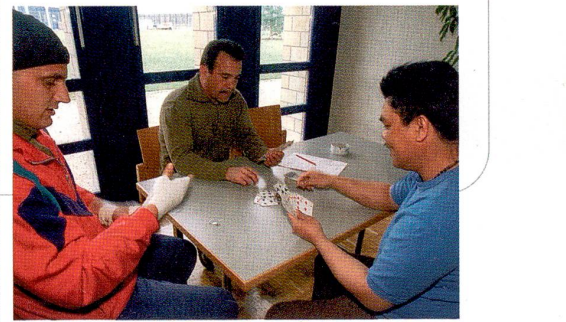
En raison d'un éventuel risque d'évasion, la part des détenus étrangers est nettement plus basse en semi-détention qu'en régime fermé.