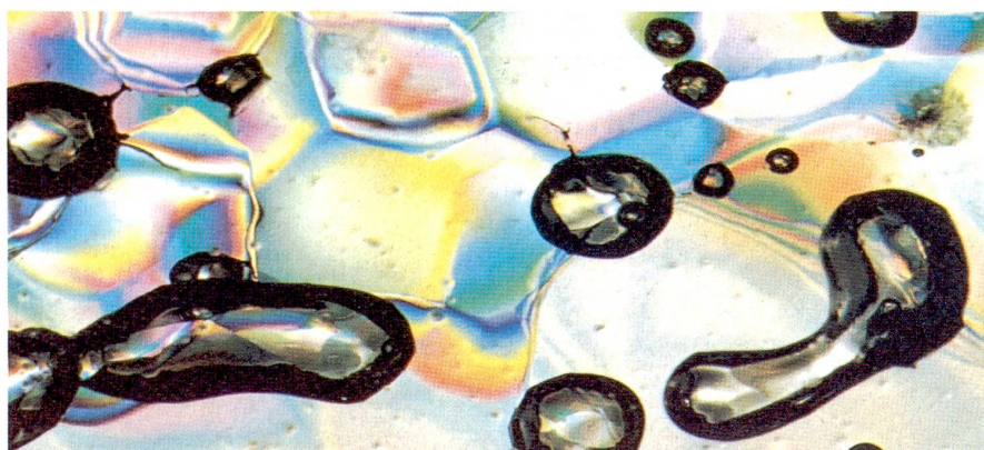
Werner Berner/Uni Bern