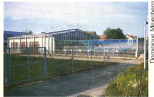
La station de recherche de Reckenholz

L'Office fédéral de l'environnement, des forêts et du paysage (OFEFP) a refusé à l'EPF de Zurich l'autorisation de pratiquer un essai en plein champ avec du froment OGM résistant aux champignons (présentée dans le numéro 49 de Horizons ). Sur la base des connaissances actuelles, on ne serait pas en mesure d'évaluer les risques éventuels pour l'homme et l'environnement, justifie l'OFEFP. L'Office fédéral critique en particulier le fait