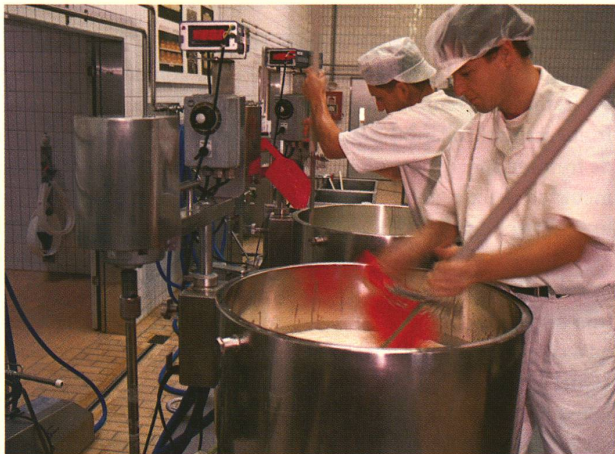
Laiterie pilote de Berne-Liebefeld: la fabrication de fromage exige une propreté méticuleuse.

présence de spores de la bactérie Clostridium tyrobutyricum si néfaste pour ce genre de fromage.