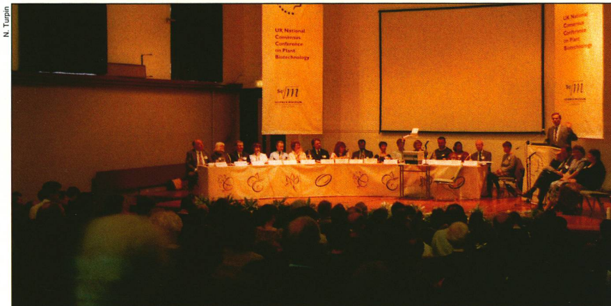
Conférence de consensus «anglaise» organisée au Musée des sciences (nov. 1994)

ment; les progrès de la génétique qui bouleversent l'éthique... En conséquence, elle met en doute la légitimité des choix politiques en la matière. Le politicien n'est pas à l'aise non plus, car il doit décider de sujets qu'il maîtrise mal. Quant aux experts – scientifiques ou ingénieurs – ils se plaignent que le public et les politiciens comprennent mal leur langage, et que l'émotivité prenne souvent le dessus sur la