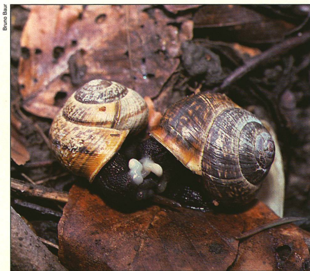
L'accouplement de deux Arianta arbustorum . Hermaphrodites, ils se fécondent mutuellement.