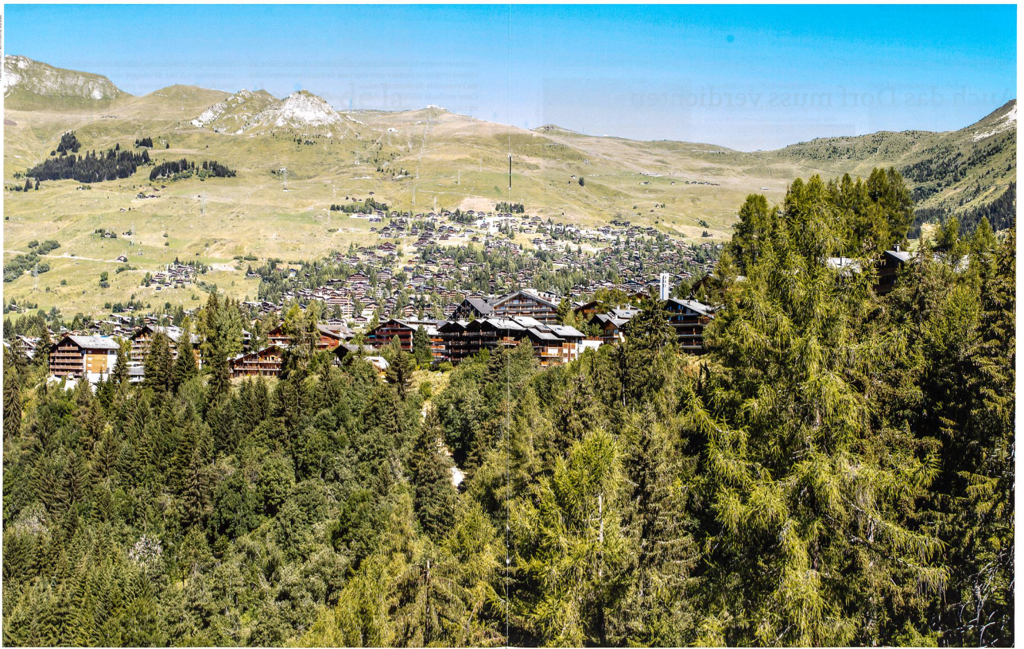
Verbier (VS): en acceptant l'initiative sur les résidences secondaires, le peuple a souhaité mettre un terme à la construction effrénée de résidences secondaires. Va-t-il également réagir face à la destruction larvée de nos monuments historiques et de notre patrimoine culturel et naturel? Verbier VS: Mit dem Ja zur Zweitwohnungsinitiative hat das Volk dem ausufernden Bau von Ferienwohnungen ein Ende setzen wollen. Wird es sich auch gegen die fortläufige Zerstörung unserer Baudenkmäler und Kulturlandschaften äussern?