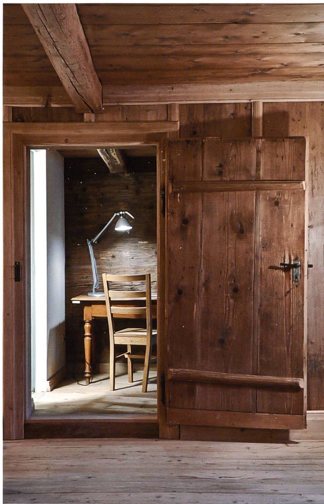
SCHINDELHAUS, OBERTERZEN (SG)

Verbringen Sie unvergessliche Ferientage in historischen Bauten.