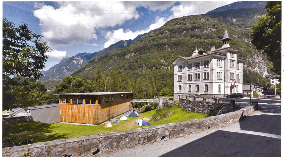
J. Rafflen / Schweizer Heimatschutz

«Weg von der Ballenbergisierung» in der Südoschweiz vom 21. Januar 2015