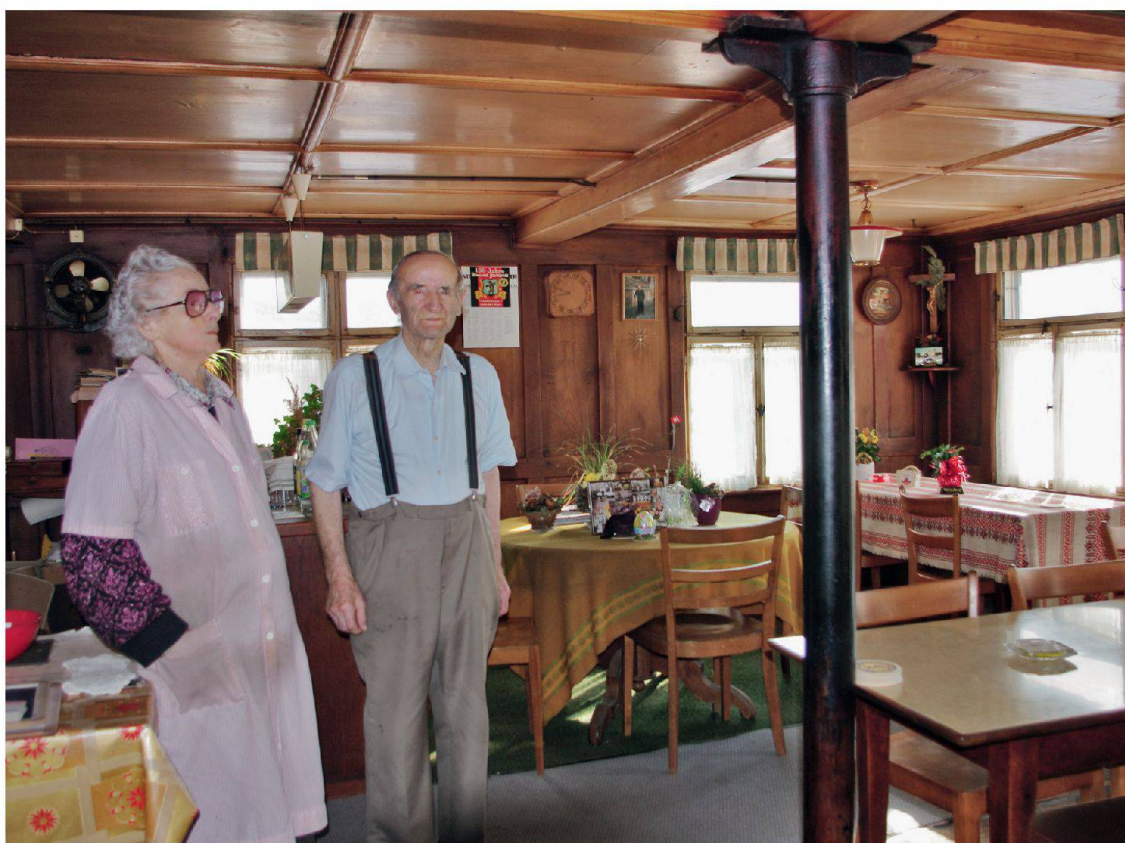
Denkmalpflege Kanton St. Gallen

Peines et joies de la conservation selon l'exemple du restaurant Sonnentäl d'Andwil, un café-restaurant villa-geois authentique à l'abandon qui avait été tenu durant plusieurs décennies par la famille Wäger.