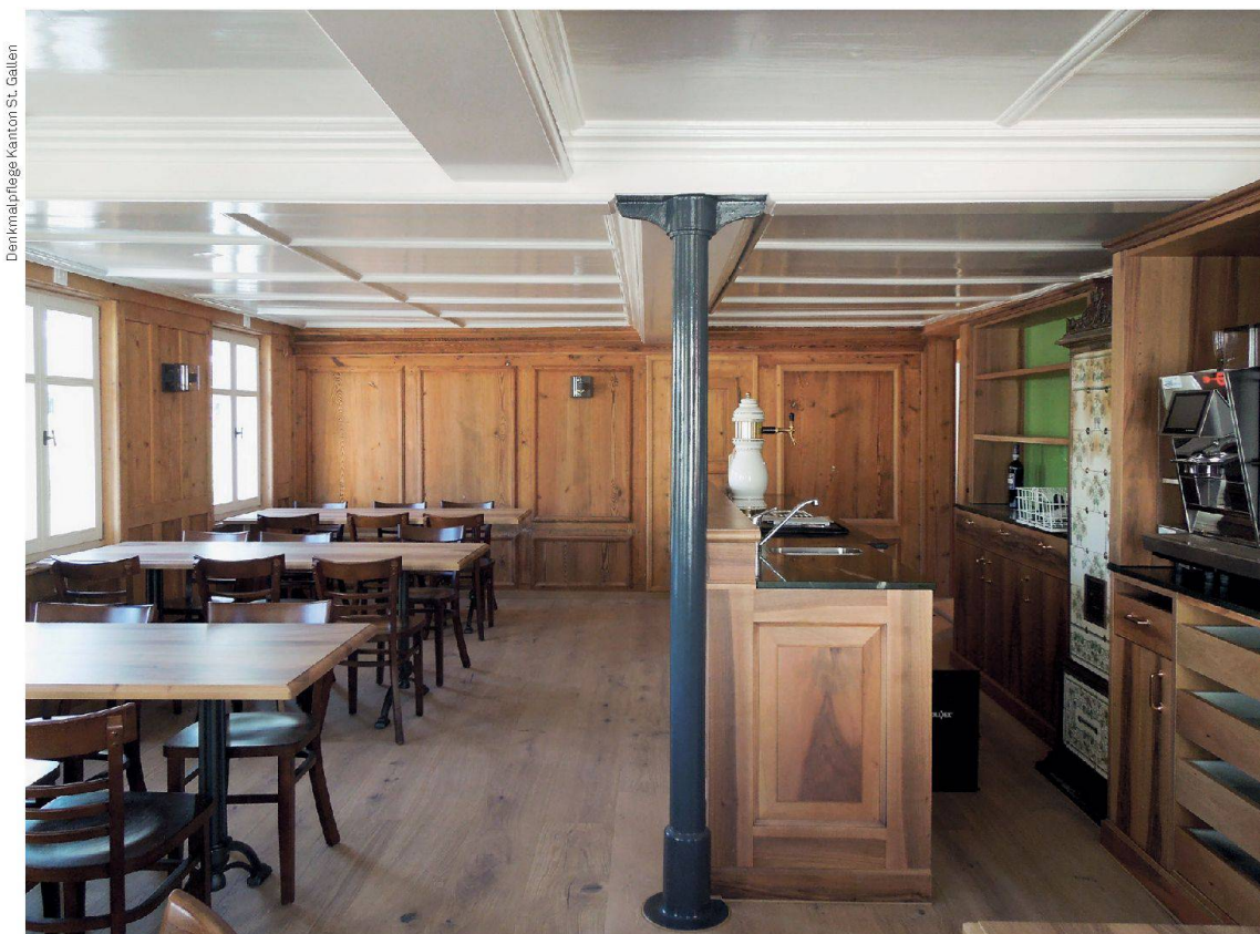
Denkmalpflege Kanton St. Gallen

Die Räume zu niedrig, die Küche zu klein, der Saal dafür viel zu gross – und das Bedürfnis nach modernen Wohnungen unvereinbar mit der Bausubstanz. Doch ein Idealist rettet das Restaurant Sonnentäl vor der Zerstückelung und renoviert Restaurant und Saal.